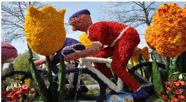
Kwiatowa parada w Holandii

Festiwal kwiatów od kilku lat odbywa się także w Australii. Nosi on nazwę Floriada i ma miejsce w stolicy czyli w Canberze. Z uwagi na to, że Australia znajduje się na południowej półkuli, wiosna rozpoczyna się tam we wrześniu, wtedy kiedy my witamy jesień.