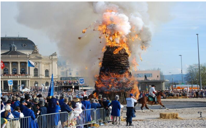
Palenie bałwana w Zurychu

będzie suche i słoneczne, a jeśli po okresie 10-15 minut oznacza to deszczowe lato.